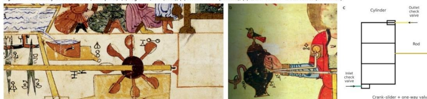
Figure 3 — Modularity across devices (kit of parts): (a) Peg drum/cam (boat); (b) Float + valve (servant); (c) Crank-slider + check valves (schematic)

شکل ۳. مدولاریتی اجزا در دستگاه‌های جزری: (a) درام میخ‌دار/بادامک (قایق نوازندگان)، (b) شناور و ولو (خدمت‌کار آبریز)، (c) میل‌لنگ-شاتون با شیرهای یک‌طرفه (بازترسیم شماتیک). ۲