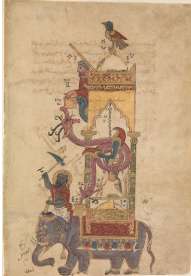
شکل ۴. ساعت فیل: ادغام زمان بندی هیدرولیکی (شناور/روزنه) با نمایش و اعلان مکانیکی. ۱