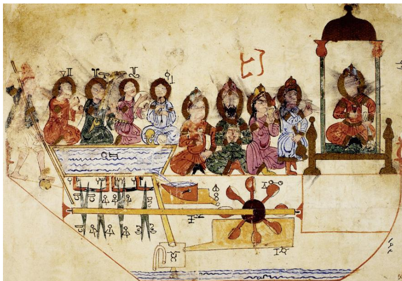
شکل ۱. قایق نوازندگان (اتماث نمایشی): درام میخ‌دار و سامانه انتقال نیرو که توالی حرکات از پیش تنظیم‌شده را اجرا می‌کند. ۱

این تحلیل که مبتنی بر بازخوانی کارکردی خود متن و تصاویر جزری است، نشان می‌دهد که منطق بنیادین برنامه‌ریزی یک توالی کنش اگرچه با فناوری‌ای کاملاً مکانیکی در کار او حضور داشته است. این همسانی مفهومی با اصل «ذخیره‌سازی برنامه» در ریاتیک و اتوماسیون امروزی معنادار است، بی‌آنکه لازم باشد ادعای یک تأثیر تاریخی مستقیم نمود (نیک‌سرشت و نظری، ۱۴۰۱).