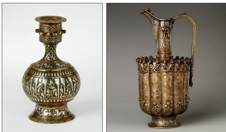
تصویر ۱۴. ابریق برنزی نقره‌کوب و سیاه‌قلم، قرن ۱۲ میلادی، ایران، خراسان، موزه‌ی

نوع تضاد در رنگ‌ها و ایجاد سایه‌روشن است که صنعت‌گران و هنرمندان فلزکار آن را به بهترین نحو بر روی اشیاء فلزی ایجاد می‌کردند» (افروغ، ۱۳۹۵، ۵۴). بنا بر این سیاه‌قلم هم شیوه‌ای از ترصیع می‌باشد. در آثار ترصیع‌شده سلجوقی عموماً کاربرد هم‌زمان شیوه طلاکوبی و نقره‌کوبی به شکل مفتولی یا ورقه‌ای و نیز کاربرد ماده سیاه‌قلم قابل مشاهده است. شایان ذکر است که طلاکوبی یا نقره‌کوبی ورقه‌ای با چکش‌کاری صورت می‌گرفته است و ورقه‌های طلا و نقره با حرارت بر روی سطح فلز پایه تثبیت نمی‌شده است بنا بر این امکان‌کننده شدن و ریختن فلزات طلا و نقره از سطح فلز پایه امکان‌پذیر بوده است. به نظر می‌رسد ماده سیاه‌قلم در کنار کارکرد تزئینی، خاصیتی لحیم‌کننده و تثبیت‌گر برای ورقه‌های طلا و نقره (بر روی فلز پایه) داشته است و ویژگی بارز هنر فلزکاری دوره سلجوقی کاربرد هنر فلزکوبی در کنار هنر سیاه‌قلم است. در تصویر (۱۴) به نمونه‌ای از ابریق برنزی متعلق به دوره سلجوقی اشاره شده است که دارای تزیینات نقره‌کوبی و سیاه‌قلم است.