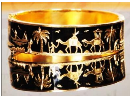
تصویر ۱۷. دستبند طلایی سیاه‌قلم شده، زیورآلات اقوام صابئین مندایی اهواز

زیباتر شدن کار، نقوش با قلم‌های مخصوص حکاکی می‌شود و در نهایت با پرداخت اثر محصول نهایی به دست می‌آید (اصغرزاده، زاهدپور، ۱۳۹۴، ۴-۵) در تصویر (۱۷) به نمونه‌ای از آثار معاصر هنرمندان صبی اشاره شده است.