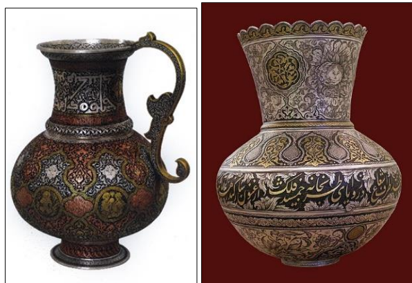
تصویر ۲۰. گلدان نقره، اثر محمد مهدی باباخانی، موزه حسن پور اراک