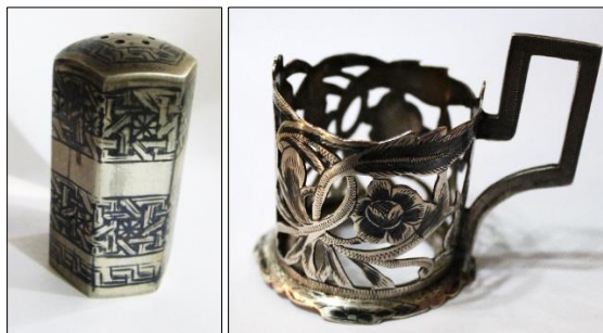
تصویر ۱۸. زیراستکانی نقره‌ای، اثر هنرمندان ارمنی تبریز تصویر ۱۹. نمکدان نقره‌ای، اثر هنرمندان ارمنی تبریز